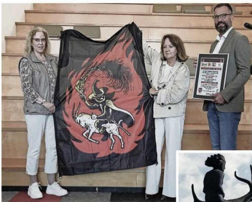
Zuletzt wurde die niederländische Stadt Brunssum in den Kreis der Bockreiter-Städte aufgenommen. Sie wird künftig am 1. Mai die Bockreiterfahne hissen, die an den Todestag des angeblichen Räuberhauptmanns Josef Kirchhoff erinnert. Denkmäler wie dieses in Herzogenrath (kleines Bild) erinnern an die Bockreiter.